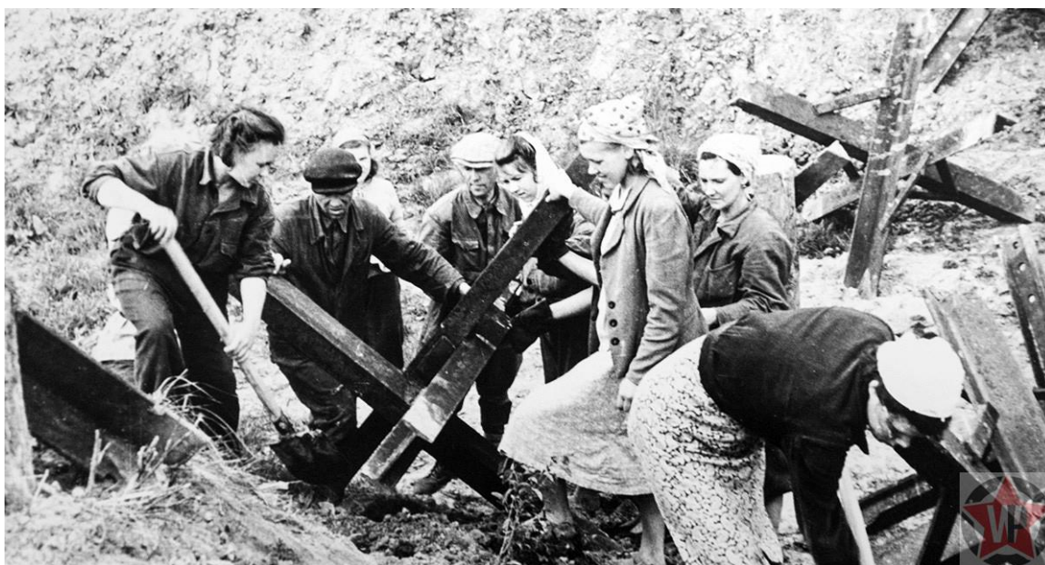
Возведение инженерных укреплений

Работали с 6 утра до 11 вечера. Осенние дожди, тяжёлая глинистая почва и неровности пересечённой местности очень усложняли работу. А трудились там, в основном женщины, которые не имели никакого опыта в сапёрных работах. Всего участвовало в возведении инженерных укреплений 600 тысяч человек.