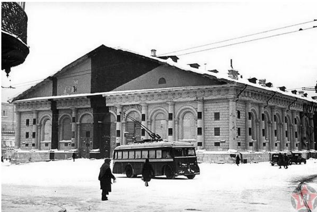
Закамуфлированное здание Манежа в Москве зимой 1941 года.

Огромные звёзды на шпилях и кресты собора закрыли фанерными щитами. Подготовили комбинации макетов городских кварталов. Через реку, которую сложно было скрыть, перебросили бутафорный мост.