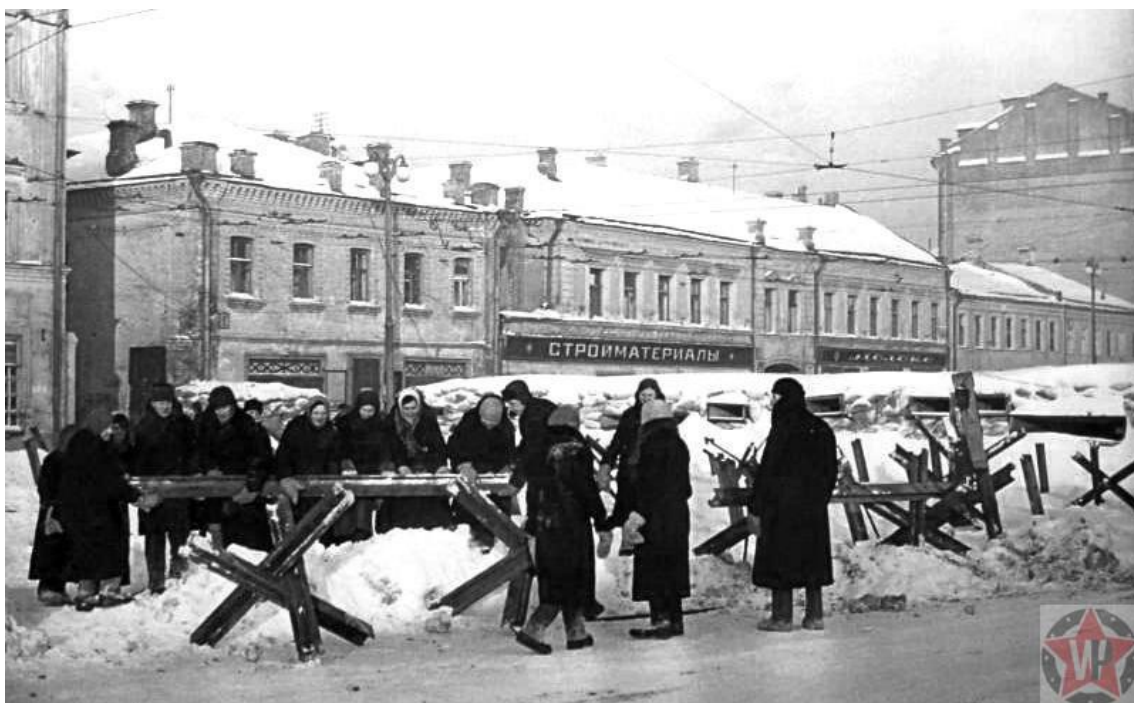
Строительство баррикад в Москве

Ночью город погружался во тьму. «Свет в окне – помощь врагу!» — предупреждали москвичей информационные плакаты противовоздушной обороны. От граждан требовалось строгое соблюдение светомаскировки. Забывчивым горожанам могли напомнить об ответственности и увесистым камнем в окно. Из добровольцев были организованы специальные отряды, в задачу которых входило обнаружение сигнальщиков – немецких диверсантов и завербованных предателей, которые подавали световые сигналы нападающим. За время осады было задержано несколько десятков таких сигнальщиков. Подобные меры предосторожности были очень важны для этого этапа московской обороны.