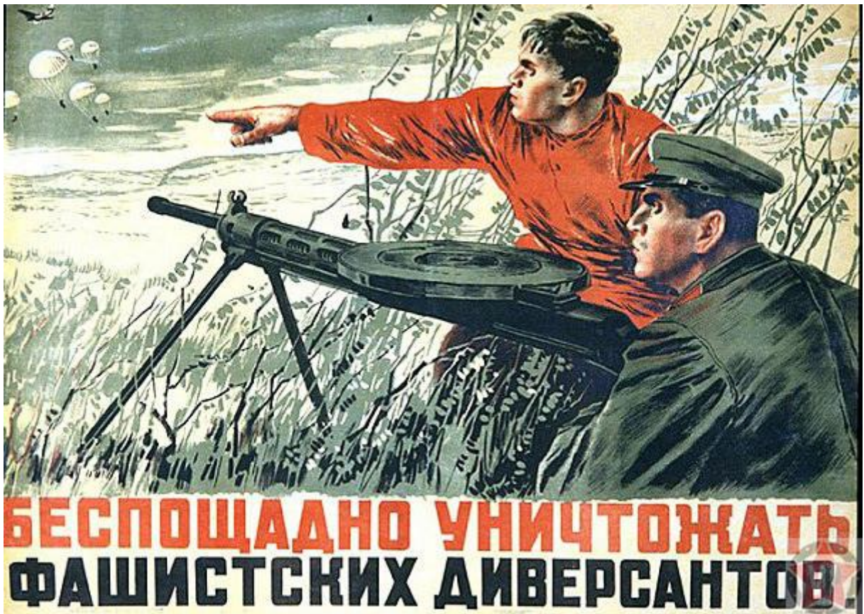
Плакаты на улицах столицы

Вокруг Москвы возвели три оборонительных кольца. Внешний рубеж включал в себя: