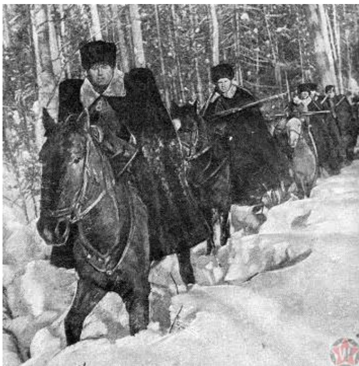
Подвиг кубанских казаков 19 ноября 1941 года

Девятнадцатое ноября – подвиг кубанских казаков в битве за Москву. На Волоколамском направлении казаки-кубанцы кавалерийского полка, ценой своих жизней задержали немцев и уничтожили 25 танков противника, не имея никакого тяжёлого вооружения.