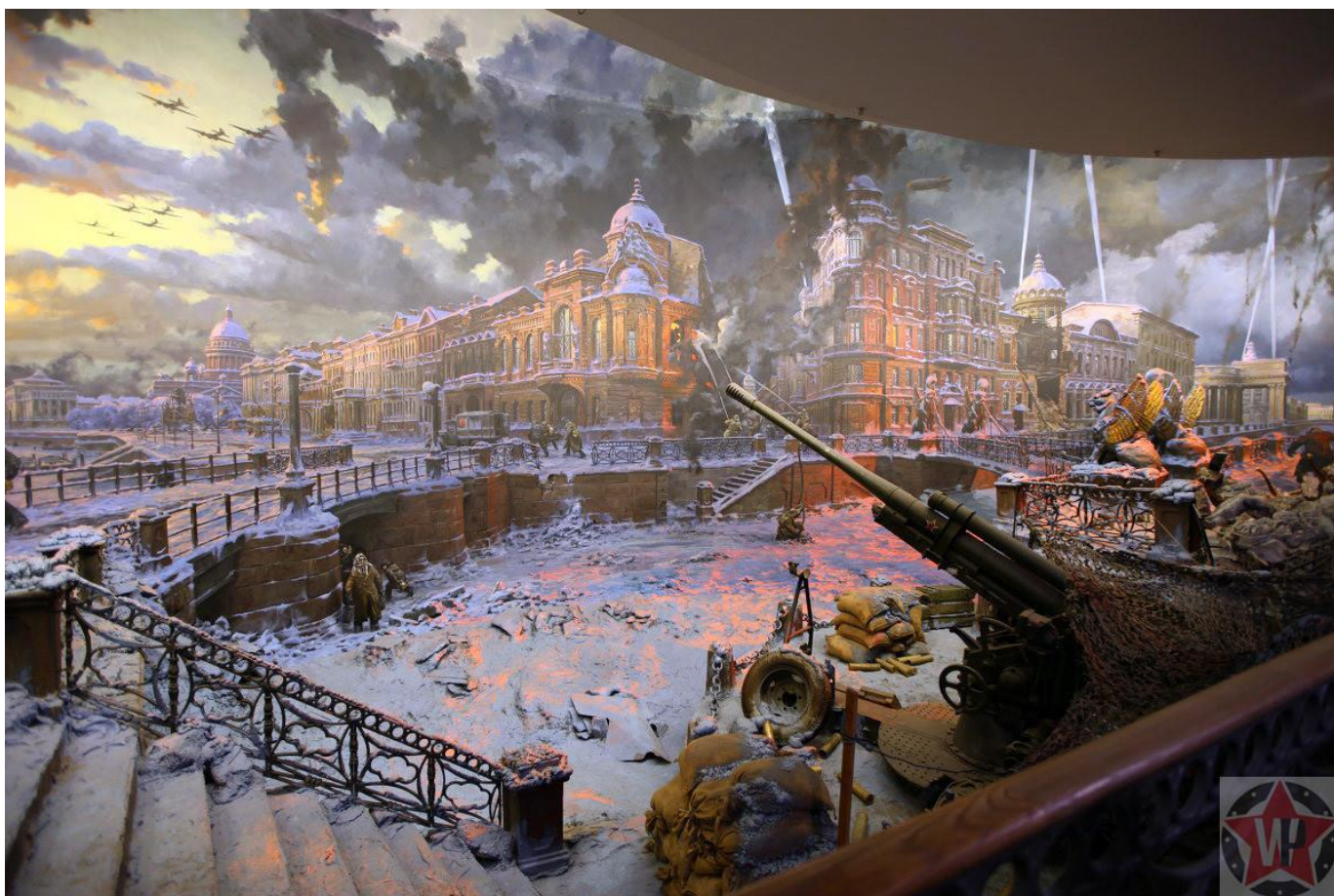
Диорама «Блокада Ленинграда»

Почти одновременно начались блокада Ленинграда и Киевская операция. Ленинград нужен был немцам как один из наиболее важных городов, поставляющих противнику новейшие разработки машиностроения и электротехнику. Перекрыв путь к городу, немцы спровоцировали голод. Также сказывался недостаток отопления – осада затянулась до зимы, и холод стал ещё одним врагом для солдат. После этого изменилась тактика: самолёты бомбили продовольственные склады, фабрики и заводы, чтобы уничтожить важные для города центры. По плану, после захвата Ленинграда войска встречались с группой, которая захватывала Киев. Здесь важной была переправа через Днепр, однако на реке немецкие войска встретили жестокое сопротивление.