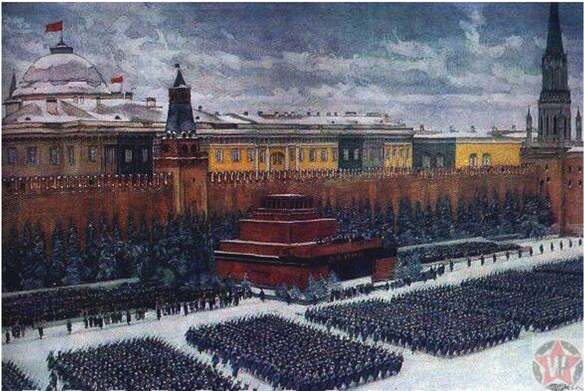
Парад на Красной площади 7 ноября 1941 — К. Юон

Непосредственно в самой битве под Москвой схлестнулось невиданное до того количество людей – около семи миллионов. На тот момент это было самое масштабное сражение во всей Второй мировой войне. Только здесь, впервые с самого начала этой величайшей войны, движение гитлеровской армии было остановлено. Обе стороны получают недвусмысленный приказ – «Любой ценой...». Да, именно любой ценой одни должны были захватить город, а другие – отстоять его. И они с лихвой заплатили эту цену. Но началось всё не тут и не сейчас.