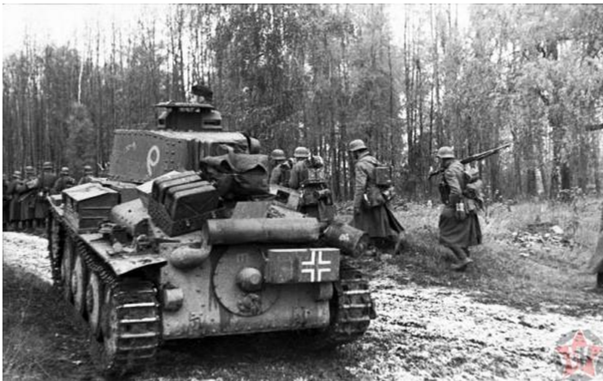
«На Москву» — германская пехота и лёгкий танк 20-й танковой дивизии

Германия напала на Советский Союз вопреки заключённому договору и без предупреждения. Поэтому ни пограничники, ни регулярные войска, ни резервы готовы не были. Это дало немецкой армии большое преимущество на первых порах. На что Гитлер и рассчитывал. Успех всей кампании напрямую зависел от стремительности и скорости передвижения. Но, несмотря на значительные успехи, с самого первого дня уже начались досадные проволочки.