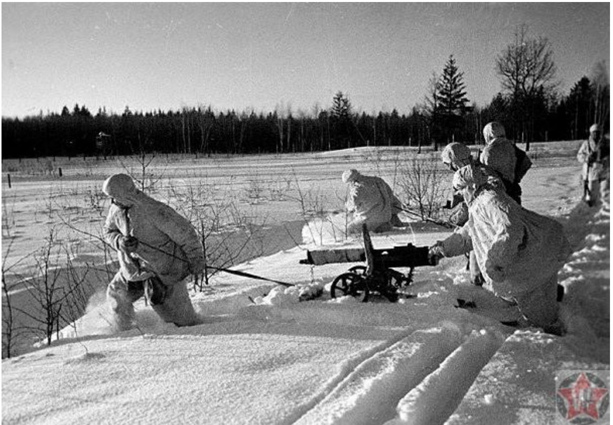
Контрнаступление: бойцы пулеметного подразделения передвигаются к переднему краю

Посёлок за посёлком, город за городом, километр за километром медленно, но неотвратно теряли захватчики. Они отчаянно старались удерживать позиции. Немцы, отступая, густо минировали территорию и ставили многочисленные ловушки. Но с каждым шагом контрнаступление лишь увеличивало обороты. К началу января 1942 года Красная армия отбросила подразделения вермахта на 100 км, а на некоторых участках на все 250 км от Москвы. Столица была вне опасности.