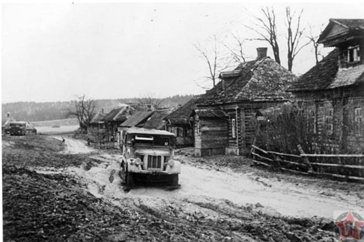
Трудные дороги Советского Союза

Восемнадцатого октября 1941 года начинаются проливные дожди, серьезно тормозящие продвижение немецкой армии. Из-за сложностей с передвижениями, колонна бронетехники сильно растягивается, становясь более уязвимой. Бойцы чувствуют перебои в обеспечении продуктами питания, боеприпасами и топливом.