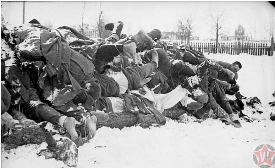
Советские и немецкие солдаты

В небольшой период (9 месяцев), англичане должны были организовать поставку 4500 танков, 3500 самолётов (истребителей и бомбардировщиков), 5000 автомобилей для разведки и 2-фунтовые орудия количеством 500 штук. Поставки следовали не только из Англии, но и из США. В первые несколько месяцев американская продукция приходила в немного меньшем количестве, чем оговаривалось, тогда как английская не отступала от предписанной. Для наглядности: вместо оговорённых 600 самолётов к концу 1941 года на территорию Советского союза от США пришло 204 самолёта. Лишь к маю поставки выровнялись, но проблемы были не по причине беспорядка в стране.