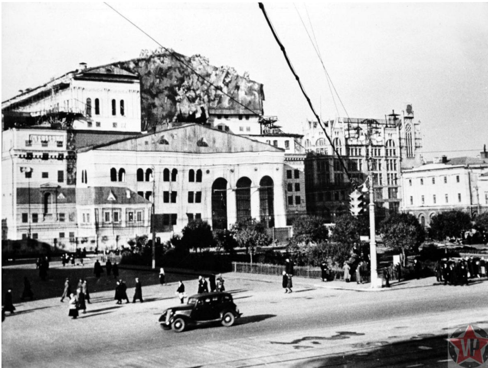
Закамуфлированное здание Большого театра