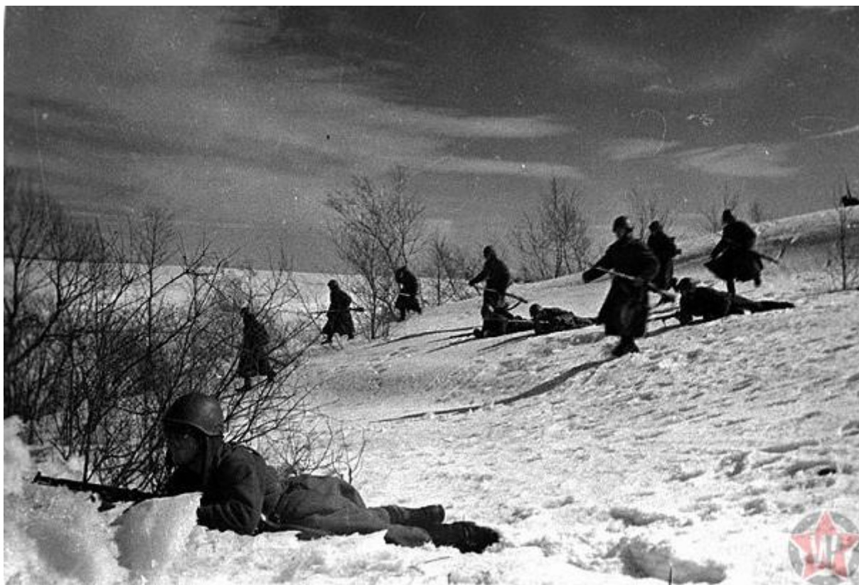
Бойцы 1-й гвардейской мотострелковой Московской дважды Краснознаменной дивизии атакуют противника

рассчитывало даже Верховное командование Советского Союза. При ощутимой поддержке местного населения город смогли отстоять. Но Гитлер продолжал гнать свои войска вперёд. Им удалось занять Красную Поляну. Тяжёлые бои шли за Тулу и Каширы.