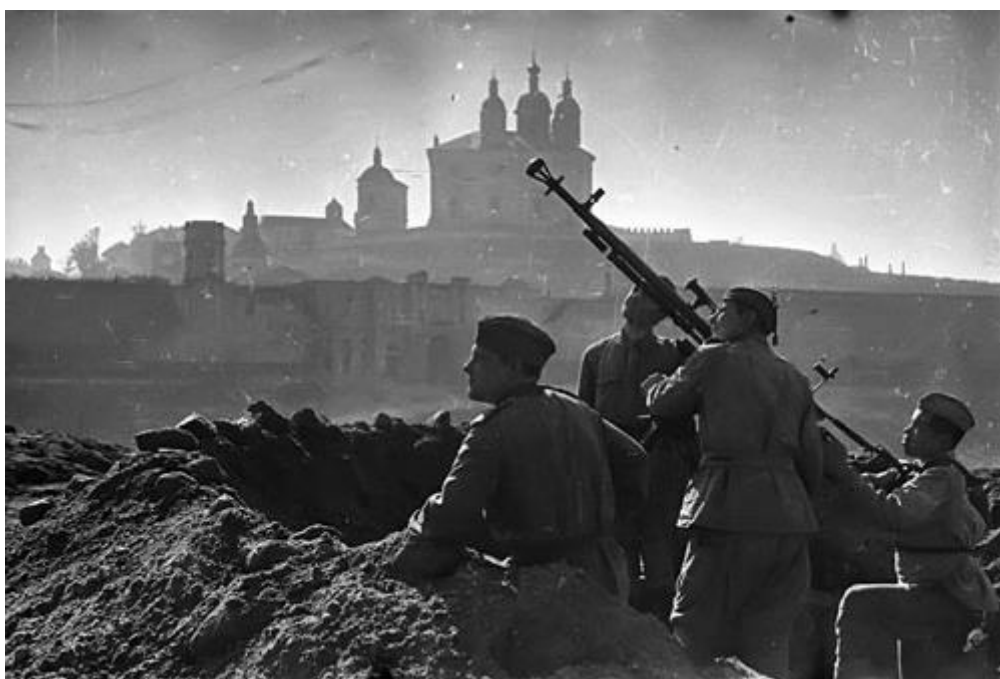
Смоленское сражение (июль-август 1941 год)

Именно с такой целью началось Смоленское сражение. Здесь немцы планировали быстро добиться успеха тактикой «разделяй и властвуй»: силы советских армий разделить на три равных окружённых лагеря, что обеспечит их быструю капитуляцию. Тогда дорога на Москву будет открыта и даже слабые дивизии, разбросанные в тылу фронта, не смогут воспрепятствовать прохождению германских войск. Хотя начало военных действий было неожиданным для Красной армии, очень скоро оборонительные сражения сменялись контрнаступлениями, из-за чего задачей войск стал если не захват столицы до конкретной даты, то до холодов.